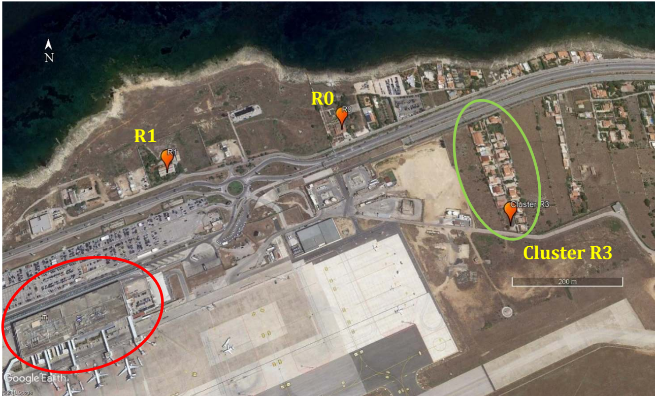
Figura 1. Inquadratura aerofotografica di dettaglio con indicazione del Terminal passeggeri, principale oggetto di intervento (in rosso), dei ricettori R0, R1 e dell'intero cluster R3

Nella Figura 1 sono inquadrati i ricettori che beneficiano in modo diretto dell'indagine ambientale e del conseguente monitoraggio delle emissioni rumorose e dispersioni di polveri.